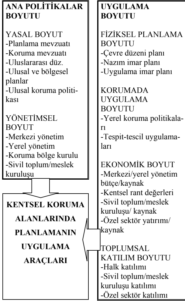
Şekil 2. Kentsel koruma alanlarında planlama sürecinin uygulama araçları