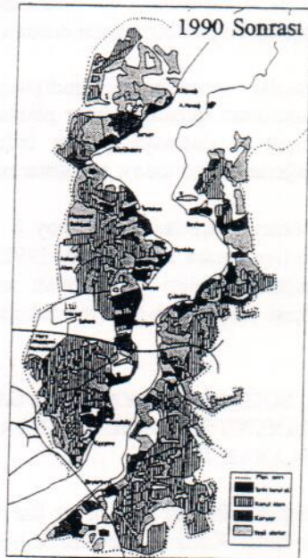
Şekil 1: 1977, 1983, 1988 ve 1990 Sonrası Boğaziçi Geri Görünüm ve Etkilenme Bölgeleri 1/5000 Ölçekli Nazım Planlarda Konut-Yeşil Alan Dağılımı